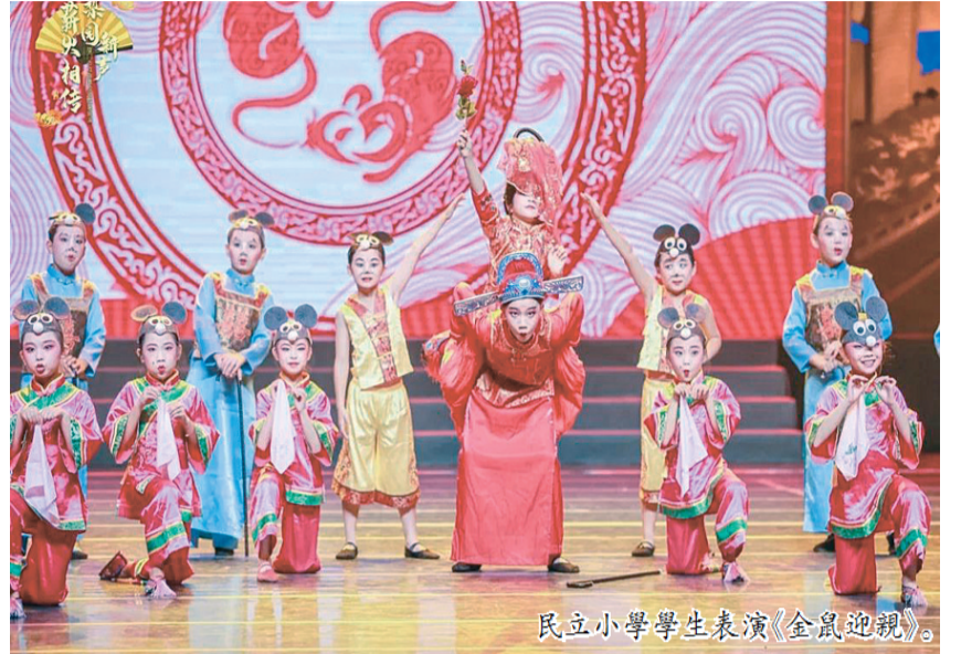
民立小學學生表演《金鼠迎親》。

數據統計，截至今年10月31日，全國六港“絲路海運”命名航綫80條，累計開行2331航次，完成集裝箱吞吐量280.95萬標箱。（曾宇珊 崔曉旭 白文斌）